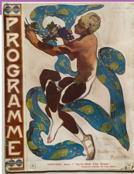
Léon Bakst, programme du ballet 'L'après-midi d'un faune' ( Ballets Russes , Paris 1912).

Collection personnelle de Toni Candeloro.