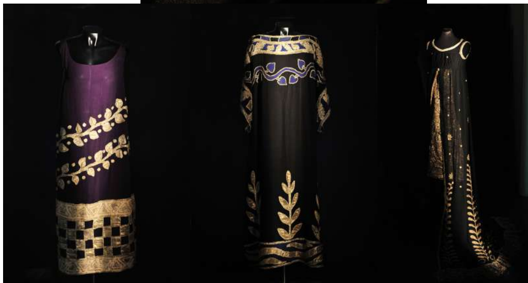
Costumes de Léon Bakst. Collection personnelle de Toni Candeloro